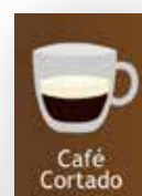
Conjunto de etiquetas 3