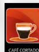
Conjunto de etiquetas 4